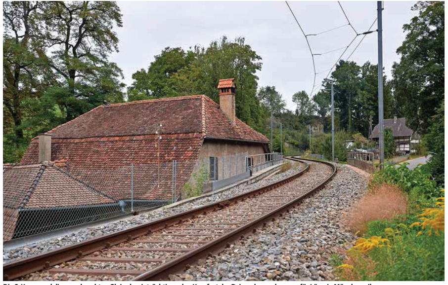
Die S-Kurve und die verschraubten Gleise beeinträchtigen den Komfort der Reisenden und sorgen für Lärm in Münchenwiler.

Bis Anfang Oktober porträtierten die FN die Ständeratskandidatinnen und -kandidaten der etablierten Freiburger Parteien.